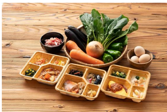
健康直球便で宅配される冷凍弁当

『健康直球便』URL： https://www.rakuten.ne.jp/gold/slc-123/