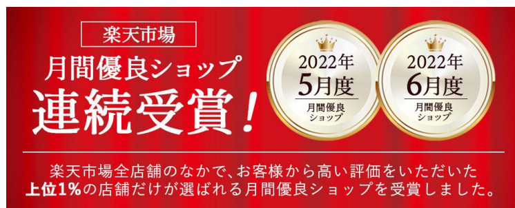
「月間優良ショップ」に2カ月連続で選出