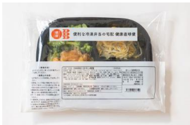
1つずつ包装されているお弁当を凍ったまま電子レンジで加熱するだけの冷凍弁当

高齢者専門宅配弁当サービスを展開する株式会社シニアライフクリエイト（本社：東京都港区、代表取締役社長：高橋洋）は、楽天市場『健康直球便』にて、2021年6月4日20時より新商品“糖質制限食”の販売を開始いたします。『健康直球便』URL： https://www.rakuten.ne.jp/gold/slc-123/?s-id=review_PC_sl_shop_02