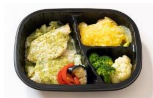
たらのバジルソース

商品特徴：1食分ずつ冷凍されているので、電子レンジで温めるだけで簡単にお召し上がりいただけます。糖質が気になるけれど、家族の食事とは別に作る方が難しい方におすすめの商品です。