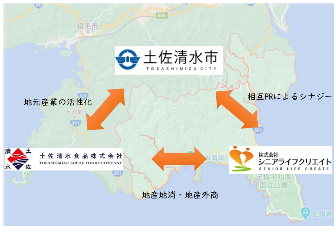
土佐清水市との包括連携協定の概要